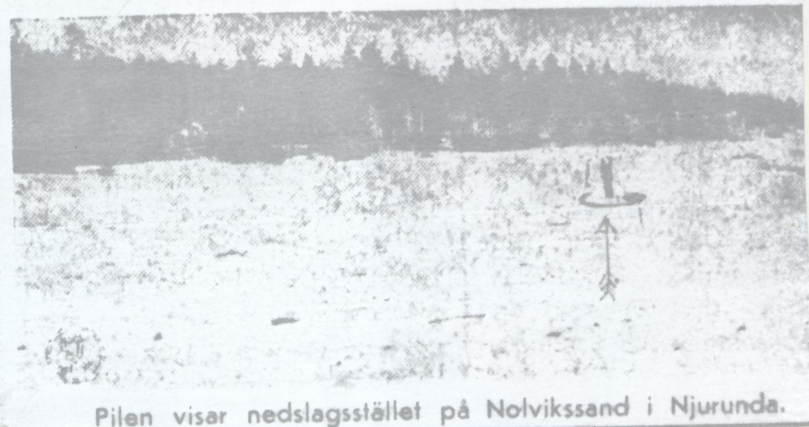
Pilen visar nedslagsstället på Nolvikssand i Njurunda.